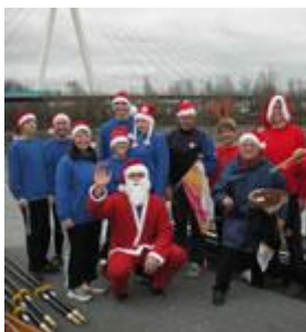
Nochmal die Ruderer und der "W-Mann"