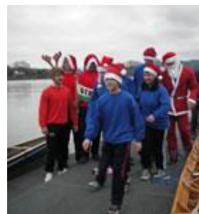
Auf der Pritsche