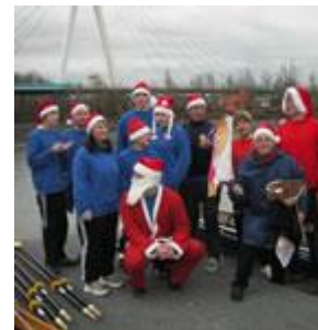
Die Ruderer und der "W-Mann"